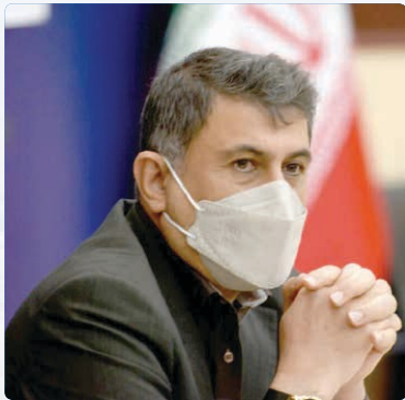
قربان و نسبتی نبوده و تمامی این عزیزان را یکسان می‌بینم.

این رو باید آن‌ها وارد میدان شده و با قدرت و شور جوانی نسبت به ارائه داشته‌های خود اقدام کنند. وی افزود: نگاه ویژه به این قشر شد و در عرصه‌های مختلف از آن‌ها درخواست شد که فعالیت داشته باشند. استاندار البرز با اشاره نقش جوانان در دوران دفاع مقدس و پیروزی انقلاب اسلامی، گفت: اکنون نیز چنین نگاهی به جوانان وجود دارد ولی خودشان نیز باید تلاش بیشتری کنند و از فرصت‌ها بهره‌برداری کافی را داشته باشند. وی خطاب به مسئولان خاطر نشان کرد: فرمانداران و دستگاه‌های اجرایی نیز باید از ظرفیت کارگروه‌های مختلف جوانان در موضوعات و بخش‌های گوناگون بهره‌برداری کنند.