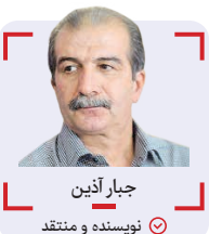
جبار آدین نویسنده و منتقد