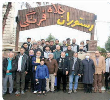
دعای خیر و سلامتی برای یکدیگر و برای همه مردم خوبمان به استقبال سال نو برونند.