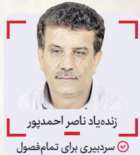
زنده‌یاد ناصر احمدپور سرمدبیری برای تمام‌فصول

می‌گویم، اما واقعاً پیشرفتی داشته و فروش دارد؟ آن سبکی که من می‌نوشتم برگرفته از خلق و خوی من بود یعنی رک‌گویی و صراحت بیان! در کنار اینها باید شم خبرنگاری هم بالا باشد. من مشکلم این است که نمی‌توانم یک موضوع خبری مهم را در دلم نگه دارم و باید حتماً مردم را در جریان بگذارم. بگذارید یک مثال بزنم. مهدی هاشمی‌نسب با من رفت و آمد داشت چون بازیکن خودم بود. آن روزها ستاره پرسپولیس هم بود. یک بار در دفتر روزنامه نشسته بودیم که یک عکس نگاتیوی استقلال برداشت و گفت فلانی تیم یعنی این، واقعا تیم خوبی است! گفتم مهدی حرف‌های عجیب می‌زنی؟ گفت بین خودمان باشد من پس فردا شب با استقلال می‌بندم. گفتم چقدر، گفت ۷۰ میلیون تومان! مهدی که رفت نتوانستم تحمل کنم و تیتتر زدم «هاشمی‌نسب با ۷۰ میلیون تومان استقلالی شد» بعد هم به منشی و خبرنگارها گفتم هاشمی‌نسب اگر رنگ زده‌گویی نیست، بگوئید اصلاً تهران نیست. به نظرم یک کار حرفه‌ای انجام دادم. انتقاد من این طور است اصلاً یا مثلاً یک بار یک تیتتر با فونت بزرگ داشتیم با عنوان «بلیط دوهزاری برای بازی دوزاری» خیلی‌ها از من انتقاد کردند. من کاملاً هدفمند این تیتتر را زدم. نه اینکه عام نویسی و زرد نویسی باشم، بلکه می‌خواستم بفهمانم که واقعاً وضع فوتبال ما این است. واقعا همین قدر خرد و کوچک با همین ادبیات کوچک و خرد!