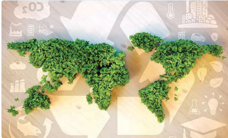
اجرای این طرح، آن را آسیب‌شناسی کنیم؟

اگر قرار است تجارب باقی شهرها را بررسی کنیم، به تجربه‌ی اخیر ملارد در جانمایی و نصب مخازن زباله‌ی زیرزمینی برای ارتقای کیفیت سیما و منظر محلات شهر و عدم دسترسی به حیوانات مودی نگاهی بیاندازیم؛ این کار را که می‌توانستیم در کرج انجام بدهیم؟ نه؟ با بودجه‌ی فرهنگی و آموزشی شهرداری کرج نیز، خیلی پیش از اجرای طرح، می‌شد ذهن شهروندان را آماده و آن‌ها را به تفکیک از مبدأ ترغیب کرد تا در عمل انجام‌شده قرار نگیرند و صبح که از خواب بیدار می‌شوند با اتفاقی روبه‌رو نشوند که روحشان از آن خبر نداشته است.