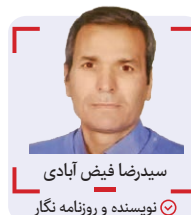
سیدرضا فیض آبادی نویسنده و روزنامه نگار

در فدراسیون تکواندو ناراحت هستند که من آنجا هستم. حتی نحوه اعلام کردن نام من هم عجیب است. می گویند قهرمان تکواندوی جهان آمده، اما من پرافتخارترین ورزشکار المپیک و مدیفرنای تیم ملی هستم. به این آقا گفتم که یا مرا نمی شناسی یا از روی عمد این کار را می کنید!