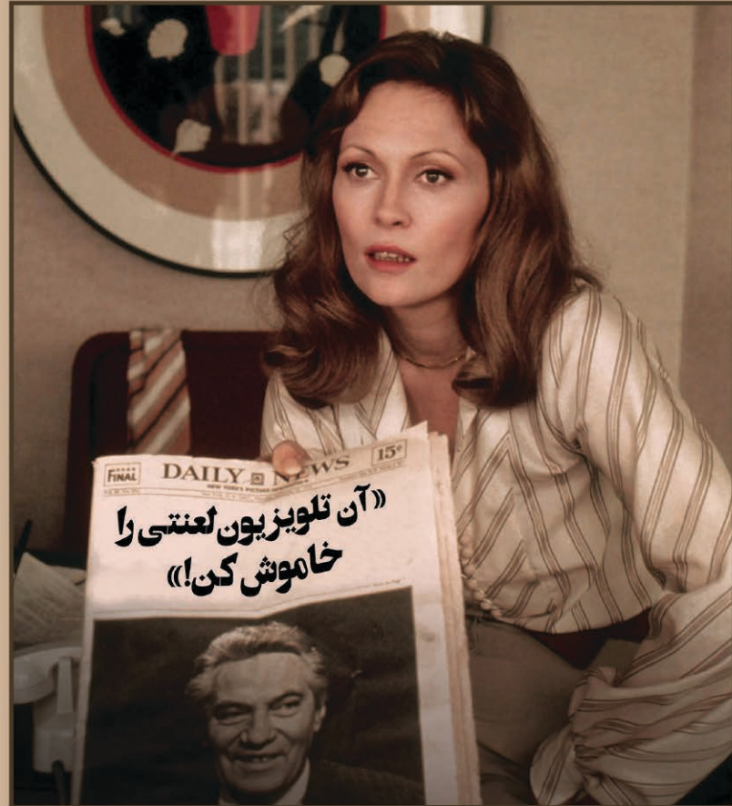
شمایل خبرنگار در سینما بانگاهی به فیلمهای:

۱۲۰ صفحه ماهنامه فرهنگی هنری دی ماه سال ۱۳۹۹ بیست و پنج هزار تومان