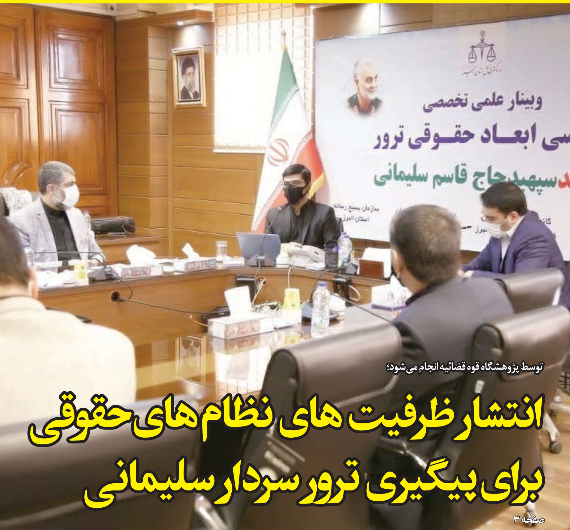
توسط پژوهشگاه قوه قضائیه انجام می شود؛