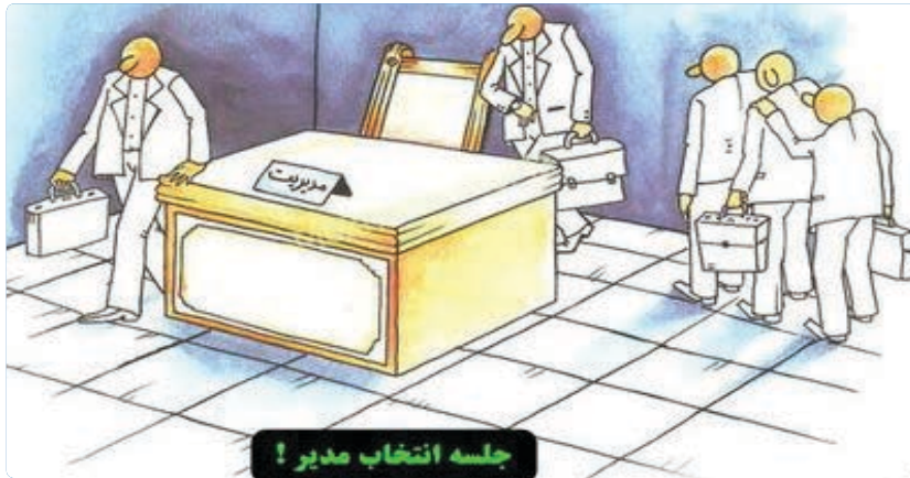
جلسه انتخاب مدیر!