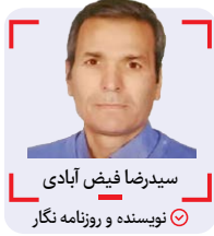
سیدرضا فیض آبادی

واقعا مسعود شجاعی که در بالاترین سطح فوتبال دنیا در لالیگا بازی کرده و تجربه دو جام جهانی را دارد اگر انتخاب قطعی مدیریت است تا نیم فصل به نتایج نگاه نکنند و دستش را باز بگذارند تا خود را بیابند و اگر در نیم فصل دورنمای کار امیدوارکننده بود که ادامه دهند و اگر نبود خود مسعود شجاعی جدا می شود و اگر هم قبل کرد که بماند و با یک مربی بزرگ تجربه بیاندوزد که چه بهتر.