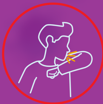
جلوی صورت را هنگام «عطسه» بگیریم