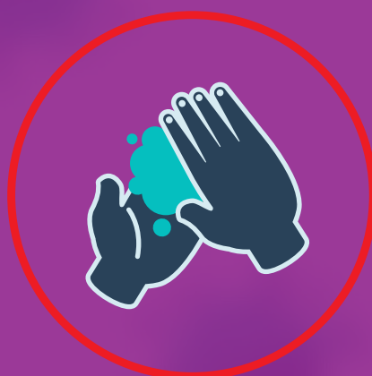
دستها را مرتب بشوئیم