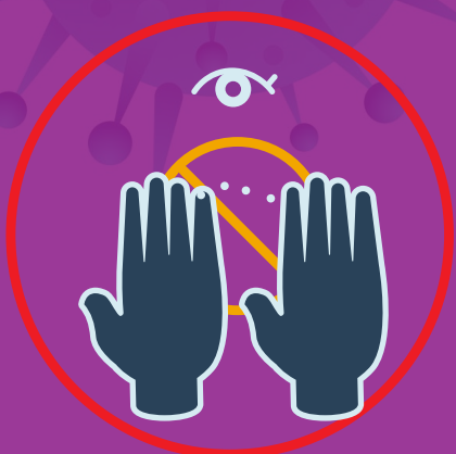
دستان را به صورتمان (چشم، گوش، بینی) نزنیم