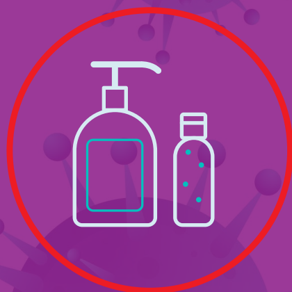
استفاده از پد الکلی و ژل و الکل برای ضد عفونی