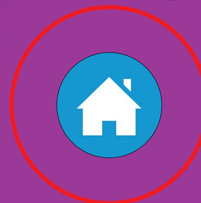
تا حد امکان از خانه بیرون نرویم