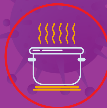
پختن کامل وعده‌های غذایی