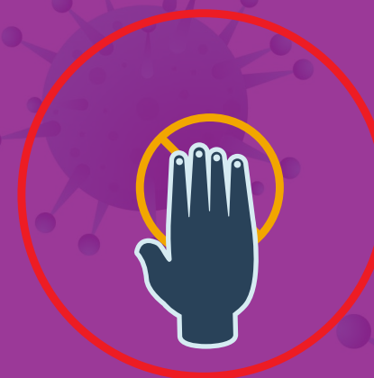
به دیگران دست ندهیم و به وسایل عمومی دست نزنیم