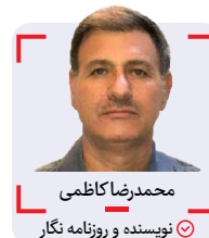
محمد رضا کاظمی نویسنده و روزنامه نگار