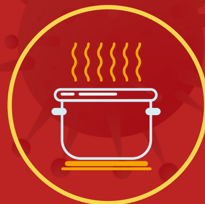
پختن کامل وعده های غذایی