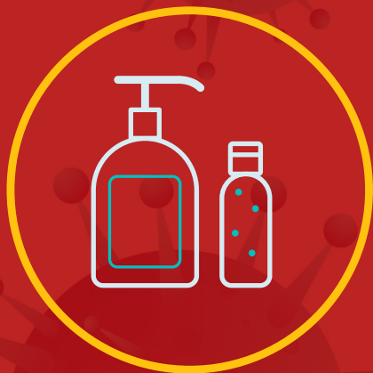
استفاده از پد الکلی و ژل و الکل برای ضد عفونی