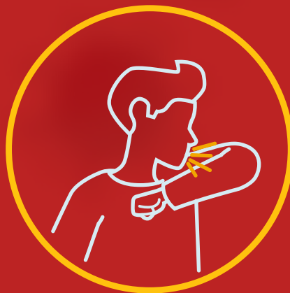
جلوی صورت را هنگام «عطسه» بگیریم