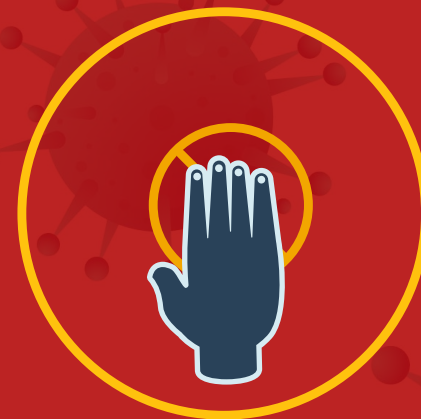
به دیگران دست ندهیم و به وسایل عمومی دست نزنیم