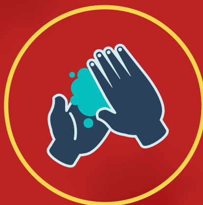
دستها را مرتب بشوئیم