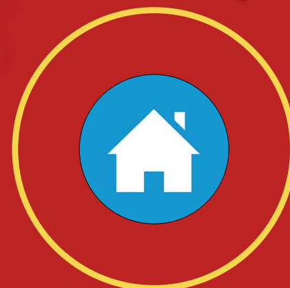
تا حد امکان از خانه بیرون نرویم