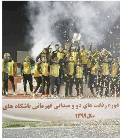
دوره رقابت های دو و میدانی قهرمانی باشگاه های کشور سال ۱۳۹۹