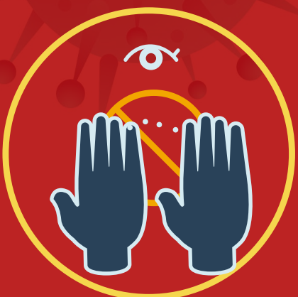
دستان را به صورتمان (چشم، گوش، بینی) نزنیم