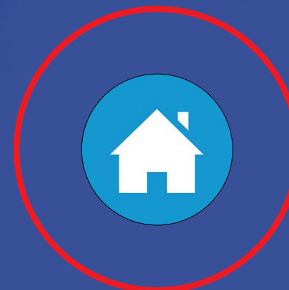
تا حد امکان از خانه بیرون نرویم