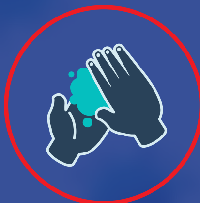
دستها را مرتب بشوئیم