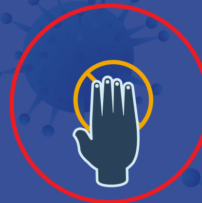
به دیگران دست ندهیم و به وسایل عمومی دست نزنیم