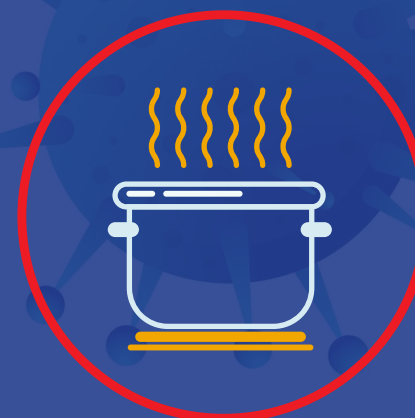
پختن کامل وعده های غذایی