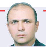
دکتر مهرداد فرشیدی نویسنده و استاد دانشگاه

جهت «موفقیت گروهی» در فوتبال برآید. یکی از همین فاکتورهای لازم برای بزرگی در فوتبال، مدیریت صحیح و کارآمد است که ما در تمام سطوح فاقد آن هستیم و لاجرم بازیکنانمان به نظم ناپذیرترین تیم های ملی و باشگاهی در فوتبال تبدیل شده اند که همواره معرف پرخاشگری، بی نظمی، عدم رعایت قوانین تیمی، بی توجهی به فرامین فنی و یکسری آیتم های منفی دیگر در فوتبال هستند. بی نظمی بازیکنان تیم فوتبال استقلال در لیگ قهرمانان آسیا در دوحه قطر که پس از حذف آن ها مقابل «پاختاکور ازبکستان» در این مسابقات عیان گردید تنها مختص مجموعه آبی در فوتبال ایران نیست بلکه آن را باید به تمام سطوح فنی، مدیریتی تدارکاتی و برنامه ریزی در فوتبال ایران تعمیم داد تا جایی که پس از ریشه یابی تمام ناکامی های فوتبال ملی و باشگاهی مان در سال های اخیر به نتایج مشترکی می رسیم که حاکی از همین موارد است.