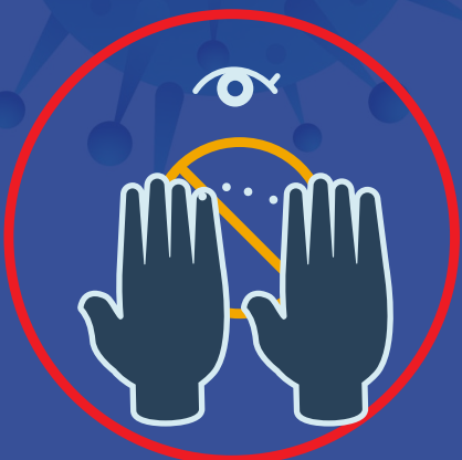
دستان را به صورتمان (چشم، گوش، بینی) نزنیم