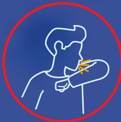
جلوی صورت را هنگام «عطسه» بگیریم