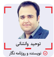
توحید وانسانی نویسنده و روزنامه نگار

«آقای متولی عزیز» حرمت مدیران دولتی در البرز دست شماست؛ کمی هوشمند باشید!