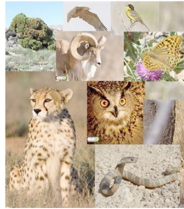
مدیرکل دفتر موزه ملی تاریخ طبیعی و ذخایر ژنتیکی سازمان حفاظت محیط‌زیست گفت: به علت شیوع ویروس

اما در نهایت یک سؤال باقی می ماند که تکلیف افرادی که به راستی جرمی مرتکب نشده اند اما این پیامک برای آن‌ها ارسال شده است، چیست؟