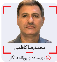
محمد رضا کاظمی نویسنده و روزنامه نگار