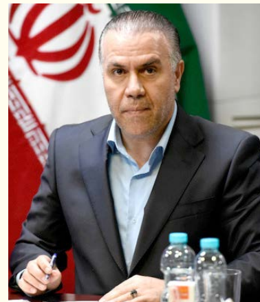
معاون استاندار البرز و فرماندار ویژه کرج تشکیل ستادهای تبلیغاتی توسط نامزدهای دور دوم انتخابات مجلس شورای اسلامی در حوزه انتخابیه شهرستان های

وی افزود: زمان پخش این برنامه ها در بازه زمانی قانونی یک هفته ای از ۱۳ شهریور تا ۲۰ شهریور ماه