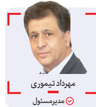
مهرداد تیموری مدیرمسئول

خشن ترین بازیکن بارسلون یعنی پوپول یادتان هست؟ دیدید وقتی صورتش مورد نوازش بازیکن حریف قرار گرفت و همبازیانش به سمت بازیکن حریف حمله ور شدند، چه رفتار مردانه ای با بازیکن خاطی داشت و چگونه از تعرض سایر همبازیانش به بازیکن حریف خودداری کرد؟ اگر همین اتفاق در فوتبال ما نه برای کاپیتان بلکه اگر برای یک بازیکن معمولی اتفاق می افتد شاهد چه ماجرابی می شدیم؟