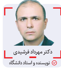
دکتر مهرداد فرشیدی نویسنده و استاد دانشگاه

در نهایت با افزایش قیمت ارزهای خارجی در بازار رسمی و غیررسمی گرانفروشی از مستمسک قانونی برخوردار گردید! در این رهگذر مشخص نشد که چه بر سر رقم افزایش