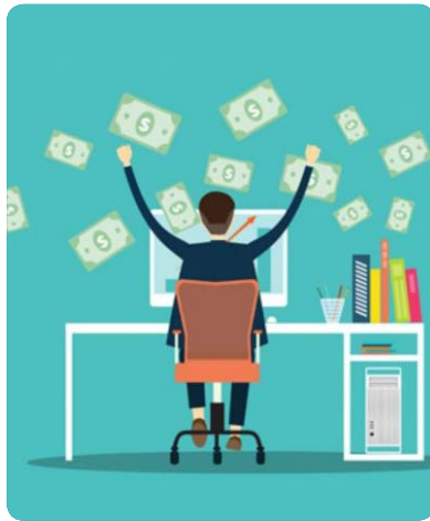
اعتماد کنند و با خیال آسوده تصمیم به خرید بگیرند. اصلا به فکر سود در این مرحله نباشید، چرا که هدف شما

حال شما فرض کنید کسب و کار اینترنتی دارید. سعی کنید در یک روز خاص و یا در یک بازه زمانی، یک هدیه رایگان (یا خیلی خیلی ارزان) تهیه و برای مخاطبین خود ارسال کنید، این هدیه می تواند از محصولات خودتان یا محصولات جانبی در کنار محصولات اصلی باشد. این روش باعث می شود که مخاطبین شما به سایت شما