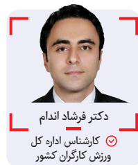
دکتر فرشاد اندام

هستند مثل استاد زنده یاد مؤذن زاده اردبیلی با آن صدای ملکوتی و خدادادی و آن اذان بی نظیرش که بارها در دنیا طنین انداز شده و همانند آواز ربنای استاد شجریان بسیاری را در ایام ماه مبارک رمضان به شور حال و وجد می آورند، علی دایی افتخار ایران و آسیا و آقای گل جهان، حسین رضا زاده که وزنه های پولادین در المپیک مقابل توان و قدرت او سر تعظیم فرود می آوردند در کشتی فرنگی نیز بزرگانی مثل علی اشکانی را به دنیای قهرمانی معرفی کرد بزرگمرد کشتی ایران و جهان و رکوردار بیشترین مدال در المپیک و جهان در رشته کشتی آزاد، استاد عبدالله موحد هم اردبیلی باشد... در سایت فیلا وقتی اسامی قهرمانان را مرور می کردیم به نام عبدالله اردبیلی موحد خوردیم و شاید بسیاری از نسل