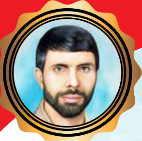
شهید علی صیاد شیرازی