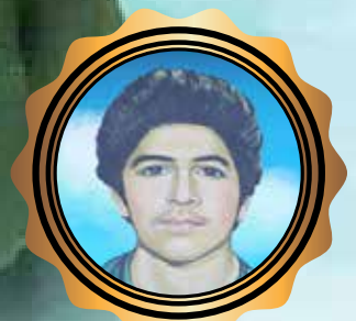
شهید حسین فهمیده

میلاد باسعادت امیر مومنان (ع) و روز مرد بر بزرگمردان بی ادعا مبارک باد