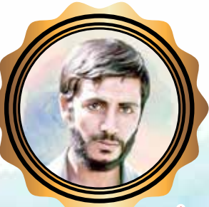
شهید ابراهیم همت