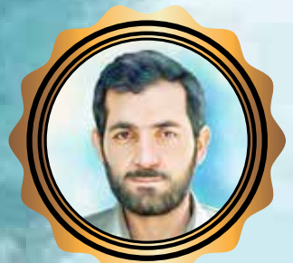
شهید مهدی باکری