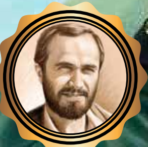
شهید محمد خرازی