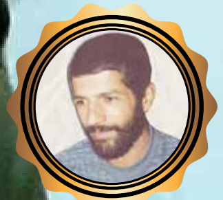
شهید مهدی شرع پسند