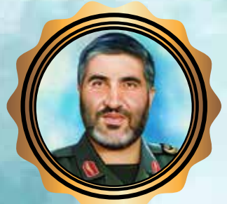
شهید احمد کاظمی