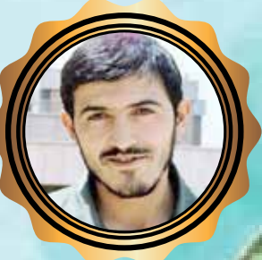
شهید مهدی زین الدین