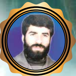
شهید شعبانعلی نژاد فلاح