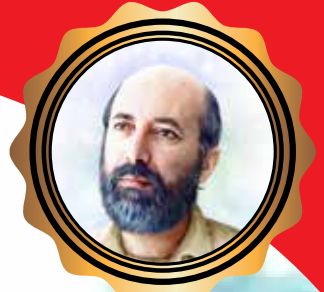
شهید مصطفی چمران