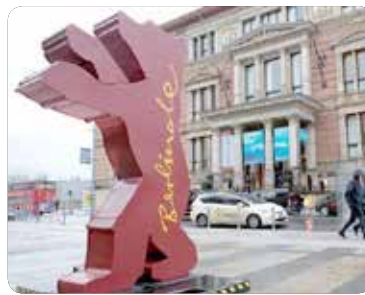
با افزایش شمار مبتلایان و قربانیان ویروس کرونا در چین، صنعت سینمای این کشور غرقه های خود را در بازار فیلم اروپا در جشنواره برلین ۲۰۲۰ لغو کرد.

«هاتیس ووتر نول» رئیس بازار فیلم اروپا نیز از لغو