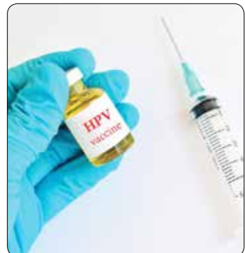
مجوز از سازمان غذا و دارو و اداره کل تجهیزات، تسهیلات خوبی به آن‌ها داده می‌شود.

فراهم شده است. وی ادامه داد: هیئت امنای صرفه‌جویی ارزی وزارت بهداشت، همکاری خوبی با شرکت‌های دانش‌بنیان برای خرید محصولات آن‌ها داشته است و تا پایان سال جاری، رکورد خوبی در مورد خرید از شرکت دانش‌بنیان زده می‌شود. وطن‌پور به تسهیلات اعطایی به شرکت‌های دانش بنیان اشاره کرد و افزود: با همکاری صندوق نوآوری و شکوفایی، سرمایه در گردش خوبی در اختیار این شرکت‌ها قرار می‌گیرد که بتوانند به استمرار تولیدشان بپردازند. همچنین جهت اخذ