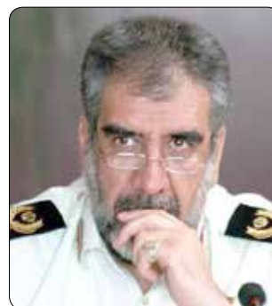
معاون هماهنگی امور اقتصادی استانداری البرز گفت: در هفت ماه نخست سال