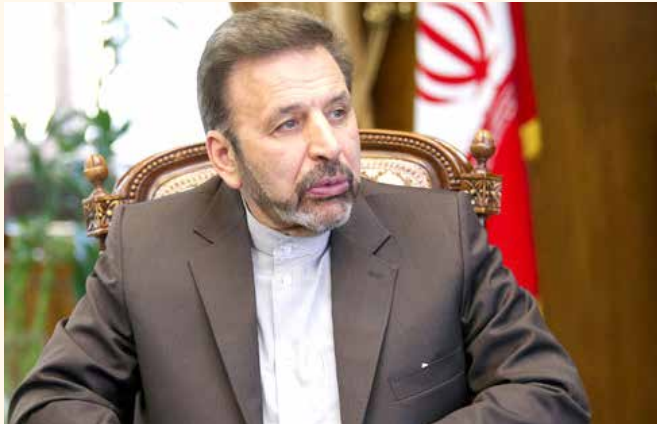
هزینه بالا و راندمان کم می توانیم به مردم از بخش های مختلف پارک علم و فن آوری یزد و شرکت های دانش بنیان استان یزد سرویس بدهیم. رئیس دفتر رئیس جمهور در این مراسم، بازدید کرد.

رئیس دفتر رئیس جمهوری گفت: تبدیل اقتصاد سنتی به اقتصاد دانش بنیان، شعار نیست بلکه یک ضرورت است.