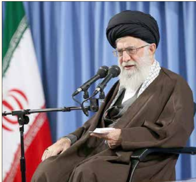
خامنه ای فرمانده معظم کل قوا در دانشگاه پدافند هوایی خاتم الانبیاء (ص) برگزار شد. محوره ای بیانات مقام معظم رهبری در این

مراسم به شرح زیر است: ۱- یکی از برنامه های دشمن، تغییر محاسبات مسئولان و مؤثران فکری و همچنین احاد مردم است تا منافع حقیقی و ملی خود را نتوانند به درستی تشخیص دهند. ۲- گاهی اوقات دشمن در رایانه عمومی مدیریت یک کشور و اندیشه و محاسبات آنها اثر می گذارد اما یک ملت آزاده هیچ گاه از این اقدام تأثیر نمی پذیرد و شجاعانه به دنبال منافع ملی خود می رود. ۳- اگر در جامعه ای امنیت نباشد، امکان فعالیت های اقتصادی، علمی و تحقیقاتی و کارهای فکری و فرهنگی وجود نخواهد داشت، بنابراین حفظ امنیت یک وظیفه فوق العاده بارز است که باید قدر آن دانسته شود. ۴- دلسوزان عراق و لبنان بدانند اولویت اصلی، علاج نامنی است و مردم این کشورها نیز متوجه باشند که دشمن به دنبال برهم زدن ساختارهای قانونی و ایجاد خلاء در این کشورها است و تنها راه رسیدن مردم به مطالبات بر حقی که دارند، پیگیری آنها در چارچوب ساختارهای قانونی است. ۵- عامل این خباثت ها و کینه روزی های خطرناک، شناخته شده هستند و در پشت این