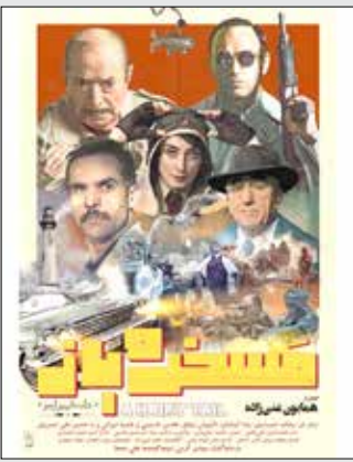
نویسنده و کارگردان: همایون غنی زاده