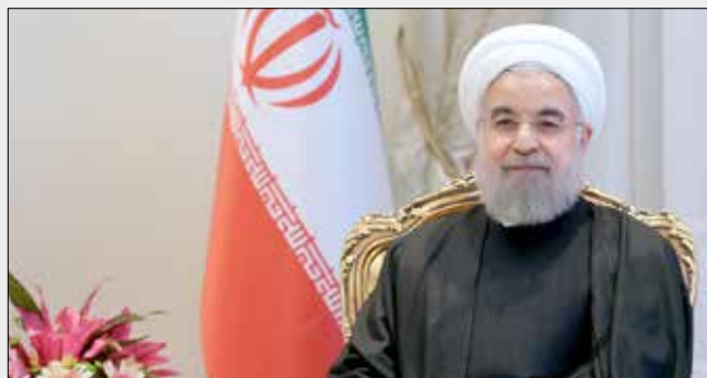
مجتهدی عادل باشد، رئیس جمهور تصریح کرد: مردمی بودن

رئیس جمهور با اشاره به اینکه بزرگترین سرمایه وزارت اطلاعات، اعتماد رهبری، مسوولین و مردم است؛ از زحمات مجموعه مدیران این وزارت در ادوار مختلف و بویژه اکنون تقدیر و تاکید کرد: شرعی، قانونی و همچنین مردمی عمل کردن، سه رکن اصلی فعالیت و ماموریت های وزارت اطلاعات است.