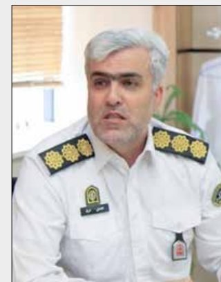
رئیس پلیس راهور استان البرز گفت: اکنون شاهد کاهش ۱۰ هزار نفری کشته های

تصادفات در تمام کشور هستیم که این موضوع اهمیت و تأثیرگذاری آموزش های همیاران پلیس را نشان می دهد.