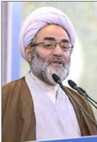
برای آنهاست، اما به دنبالش فرمودند که من به وضع موجود قانع نیستم.

وی با بیان این که، ما هم به نیروهای انتظامی جمهوری اسلامی افتخار می‌کنیم، گفت: امروز اقتدار کشورمان را در مرزهای جغرافیایی و داخلی، بخشی را مدیون این نیروها هستیم که مجدانه برای نظم و امنیت تلاش می‌کنند. وی اضافه کرد: نیروی انتظامی جمهوری اسلامی ایران توانسته بخشی از ناهنجاری‌هایی که عده‌ای در داخل جامعه ایجاد می‌کردند و می‌کنند، سامان دهد؛ پلیس راهور، فتا، پلیس بین الملل، مرکز فوریت‌های پلیس، بازرسی و پلیس و ... همه در مقام ایجاد فضای امنیتی برای مردم هستند. خطیب جمعه رشت در بخش دیگری از خطبه‌ها با اشاره به فرمایشات سoudمند چند روز گذشته رهبری در جمع فرماندگان سپاه پاسداران انقلاب اسلامی گفت: رهبری فرمودند که سپاه بسیار کار کرد، خدمات انجام داد و من از سپاه راضی هستم، این سخن مدال افتخاری