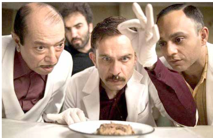
نمایی از فیلم «مسخره‌باز»