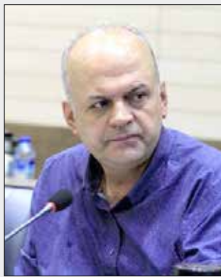
منظور حفظ بهداشت عمومی و پیشگیری از بروز آلودگی اقدام کنند.

به گفته کرونی، با وجود اینکه پرداخت مدل حمل و نقل تهران به عنوان بخش مرکزی و پیش‌نیاز طرح جامع از اهمیت ویژه‌ای برخوردار است و همچنین زمان در نظر گرفته شده از سوی شورای شهر برای ارائه نتایج طرح جامع حمل و نقل تهران ابتدای سال ۹۹ است، متأسفانه ناکارآمدی مدیریتی و عدم هماهنگی در معاونت حمل و نقل شهرداری تهران در پیگیری و هدایت فرآیند مطالعات طرح جامع مشهود است و با وجود گذشت بیش از یکسال از آغاز مطالعات، نتایج به روزرسانی اجرای مدل حمل و نقل مشخص نشده است. همچنین داده‌های مورد استفاده، مربوط به سال ۱۳۹۳ بوده و با توجه به وجود تغییرات سریع اقتصادی، سیاسی، اجتماعی و تکنولوژیکی، آمار مرتباً در حال تغییر بوده و این امر در دقت پیش‌بینی سفر در مدل نهایی، تأثیر به سزایی خواهد داشت. این در حالیست که در بسیاری از مطالعات حمل و نقل شهری کلان شهرهای پیشرفته دنیا، از آمار مبداء-مقصد داده‌های تلفن همراه استفاده می‌شود. البته ضعف معاونت حمل و نقل منحصر به حوزه مطالعات نبوده و در حوزه اجرا منجمله مترو، تاکسیرانی و... نیز کاستی‌ها روز به روز مشهودتر می‌شود.