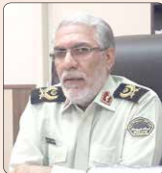
سارق موبایل قاپ با تلاش ماموران پلیس آگاهی استان البرز دستگیر و به ۱۵۰ فقره

سرقت در این استان اعتراف کرد. سردار سید جعفر حسینی، جانشین انتظامی استان البرز روز گذشته اظهار داشت: در پی وقوع چند فقره سرقت با شیوه قاپ زنی توسط راکب یک موتورسیکلت در مناطق مختلف کرج و فردیس موضوع در دستور کار پایگاه یکم پلیس آگاهی قرار گرفت. ماموران پلیس آگاهی با همکاری کلاتری