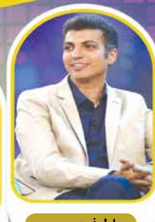
عادل فردوسی پور