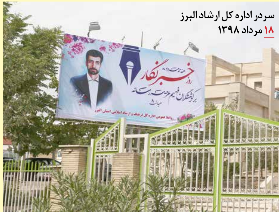
سردر اداره کل ارشاد البرز ۱۸ مرداد ۱۳۹۸