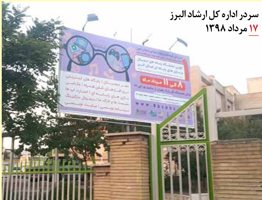
سردر اداره کل ارشاد البرز ۱۷ مرداد ۱۳۹۸