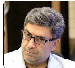
مدیر منطقه ۹ شهرداری کرج گفت: شورای شهر کرج بیش از ۲۰ میلیارد تومان برای

او ادامه داد: با رایزنی مجدد شهرداری، امسال موفق شدیم این شش هکتار را آزاد سازی کنیم تا در آن طرح‌های مختلف فرهنگی و