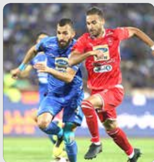
و فقط میزبانی می‌کنیم بنابراین مسئله هم پوشانی غیرممکن است.

بودجه مضاعفی را در کنار جذب بازیکن برای پرداخت بدهی‌ها کنار گذاشته باشند. تعداد شاکیانی که اعلام شده ۲۵ نفر است اما می‌دانیم تعداد آنها بیشتر از این تعداد است.