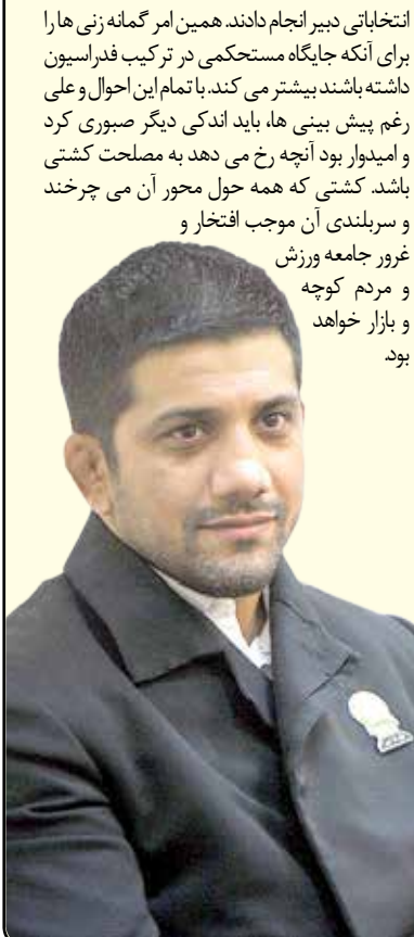
غرور جامعه ورزش و مردم کوچک و بازار خواهد بود.

آینده باری دهند. هنوز هیچ کس به درستی نمی داند علیرضا دبیر برای اداره فدراسیون کشتی چه کسانی را در کنار خواهد داشت. به جرات می توان اذعان کرد حتی یاران نزدیک وی نیز اشراف و احاطه چندانی نسبت به کارگزاران آینده فدراسیون ندارند هرچند ممکن است صحبت هایی در میان بوده باشد اما هنوز قطعیت موضوع روشن نیست. علی رغم این موارد، تصور نمی رود فردی چون دبیر بی گذار به آب زده باشد. به قول خودش در کشتی سرش کلاه نمی رود به همین دلیل تردید نداریم که پیشاپیش در این رابطه بررسی های لازم را انجام داده و می توان تصور کرد که بلافاصله پس از انجام مراسم معارفه با اختیاراتی که از مجمع گرفته، دبیر و نایب رییس خود را را معرفی می کند تا امور جاری معطل نماند. قطعاً کسانی که وی معرفی خواهد کرد چهره های شاخصی هستند که می توانند در پیشبرد اهداف فدراسیون و همراهی با کلیت مجموعه نقش بسزایی ایفا کنند. برخلاف تصور خیلی ها که گمان دارند با توجه به فعالیت علیرضا دبیر در کشتی آزاد و مطابق سنوات گذشته، آزادکاران نقش مهمی در فدراسیون وی خواهند داشت به نظر می رسد اینبار نقش فرنگی کاران در فدراسیون پررنگ تر خواهد بود چرا که تردید نداریم این جمع و بزرگان آنها نقش پررنگی در انتخابات چهارشنبه گذشته داشتند و مهمتر از آن طی ماههای پیشین تلاش وافری در راستای پیشبرد اهداف