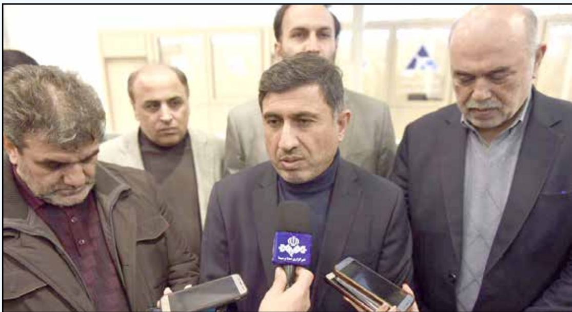
در بازدید استاندار البرز از فرودگاه پیام؛