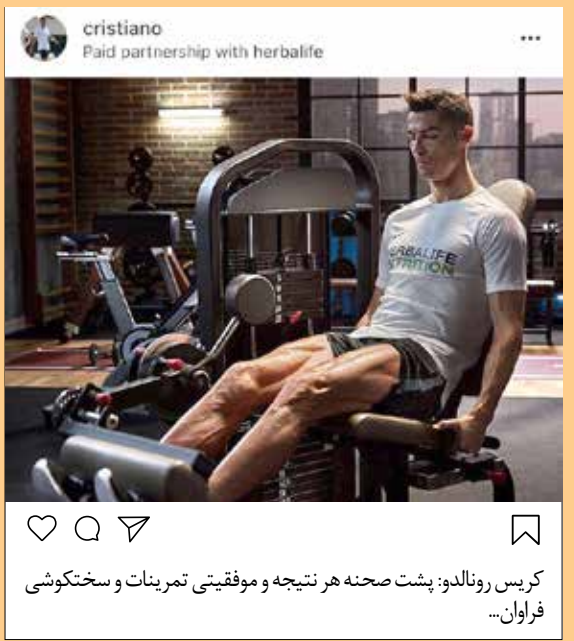
کریس رونالدو: پشت صحنه هر نتیجه و موفقیتی تمرینات و سختکوشی فراوان...