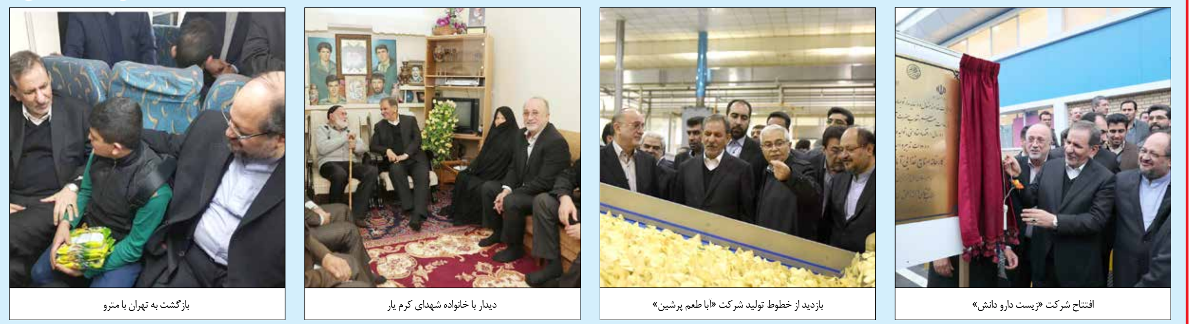
بازگشت به تهران با مترو | دیدار با خانواده شهدای گرم یار | بازدید از خطوط تولید شرکت «آبا طعم پرشین» | افتتاح شرکت «یست دارو دانش»