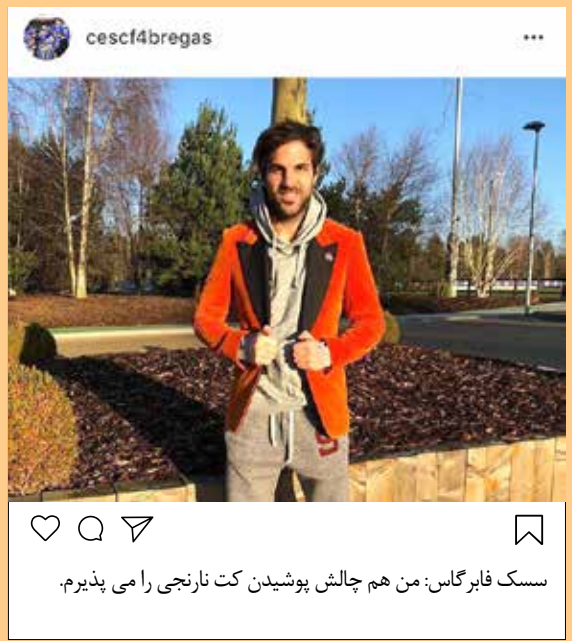
سک فابریاس: من هم چالش پوشیدن کت نارنجی را می پذیرم.