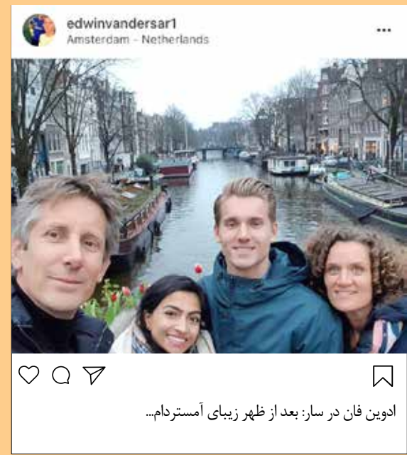
ادوین فان در سار: بعد از ظهر زیبای آمستردام...