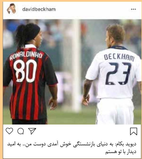
دیوید بکام: به دنیای بازیکنان خوش آمدی دوست من... به امید دیدار با تو هستم