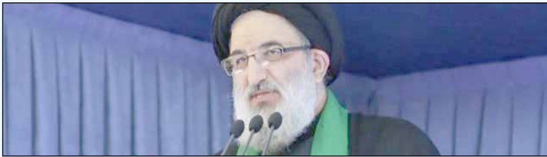
فشار مقدس زیر سایه جنجال نامقدس