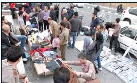
این طرح رای بدهیم.

۳. تاکید داشتند که تلاش بیشتری برای کاهش نرخ دلار بشود. گفتم من هم معتقدم نرخ فعلی به هیچ وجه قیمت ذاتی دلار نیست و برای تعدیل آن برنامه داریم و مطمئن باشید تمام تلاش خود را مصروف تقویت ارزش پول ملی خواهیم کرد.