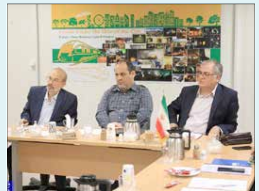
شهرداری کرج برگزار شد.