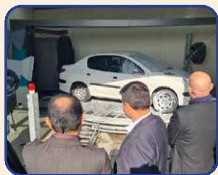
مدیرکل اداره صمت استان البرز: با افتخار امروز در فهرست برندهای برترمان، برند ابراهیم را هم اضافه کرده‌ایم

مدیرکل صنعت، معدن و تجارت البرز افزود: در دوره‌ای که دکتر آیینی، مدیر کل محترم استاندارد البرز، هم در حوزه استاندارد مسئولیت پذیرفتند، تعامل بسیار خوبی بین حوزه صنعت و استاندارد که بعضاً در سنوات قبل به این خوبی پیاده نمی‌شد، در حال حاضر برقرار است. سالی یک ثبت اختراع در شرکت ابراهیم آن هم در سطح صنعتی که ارزش برای کشور باشد، خبر خیلی خوبی است. می‌دانید که یکی از مشکلات جدی صنعت ما بحث ارز است و هر واحدی که بتواند در این زمینه گام‌های خوبی بردارد و ارزشی داشته باشد، به شدت مورد حمایت است و قطعاً در سرنوشت مردم در استان مؤثر خواهد بود.