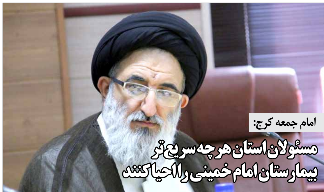
امام جمعه کرج: