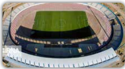
برای پروژه‌های ورزشی شهرستان فسا؛

وی ادامه داد: برای داشتن ایران قوی باید ورزش قوی داشته باشیم و این فرمایش رهبر معظم انقلاب است. من و همه همکارانم تلاش می‌کنیم که شرایطی ایجاد شود که شاهد توسعه ورزش چه در بخش قهرمانی و چه بخش همگانی باشیم.