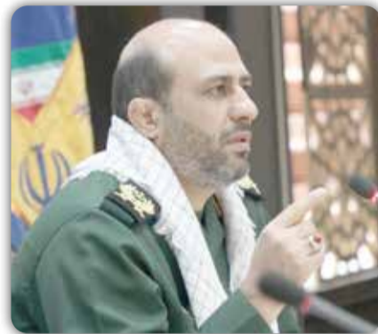
خواهد کرد و قدرت واقعی ایران اسلامی را از نزدیک لمس خواهد کرد.