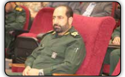
جانشین فرمانده سپاه استان البرز با اشاره به جنگ روانی دشمنان پیرامون سامانه تاد، گفت: سامانه تاد توان رهگیری و مقابله با موشک‌های هایپرسونیک ایران اسلامی را ندارد. به گزارش «دنیای هوادار»، سردار سرتیپ دوم پاسدار

«مجتبی کرمی» شب گذشته در دهمین گردهمایی پیشکسوتان لشکر ۱۰ سیدالشهدا (ع) که در مجموعه فرهنگی دفاع مقدس استان البرز برگزار شد، با اشاره به جنگ روانی دشمنان پیرامون سامانه تاد، افزود: بنابراین در صورت کوچکترین خطای دشمن، سرنوشت سامانه تاد به سرنوشت سامانه پوشالی گنبد آهنین تبدیل خواهد شد. وی یادآور شد: ایران در هر ۲ جنگ جهانی اول و دوم اعلام بی‌طرفی کرد اما در هر ۲ جنگ جهانی، کشور ما مورد تجاوز نیروهای بیگانه قرار گرفت بطوری‌که در جنگ اول جهانی حدود ۹ میلیون نفر و در جنگ دوم جهانی حدود پنج میلیون نفر توسط بیگانگان در کشور ما به شهادت رسیدند. کرمی افزود: این در حالی است که در جنگ تحمیلی که