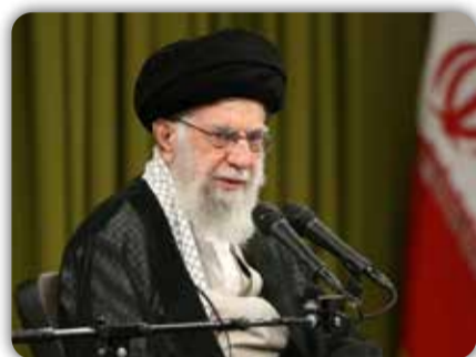
والسلام علی عباد الله الصالحین سیدعلی خامنه‌ای ۲۸ مهر ۱۴۰۳

او چهره‌ی درخشان مقاومت و مجاهدت بود؛ با عزم پولادین در برابر دشمن ظالم و متجاوز ایستاد؛ با تدبیر و شجاعت به او سبلی زد؛ ضربه‌ی جبران‌ناپذیر هفتم اکتبر