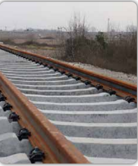
راه آهن در مورد همه چیز تصمیم می‌گیرد و نیاز است که ساختار اصلاح شود.

قیمت‌گذاری دستوری، چالش دیگر صنعت ریلی وی در ادامه با بیان اینکه قیمت‌گذاری دستوری بلیت قطار نیز از چالش‌های دیگر این صنعت است، گفت: قیمت‌ها باید متناسب شود تا سرمایه‌گذاران بتوانند با نقدینگی حاصل از آن واکن‌های جدید خریداری کنند. اینگونه نمی‌شود که قیمت‌گذاری دستوری انجام داد ولی از آن طرف با قیمت‌های روز و بالا اقدام به خرید تجهیزات و لوازم یدکی واکن‌ها کرد.