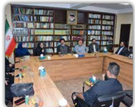
امام جمعه شهرستان فردیس با اشاره به حفظ حریت رسانه‌ها گفت: رسانه‌ها اگر به مسئولیت خود عمل کنند کشور توسعه می‌یابد.

امام جمعه فردیس تأکید کرد: رسانه‌ها حریت خود را حفظ کنند؛ وظیفه خود به عنوان امام جمعه می‌دانم بدون هیچ