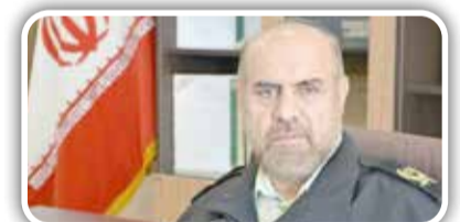
فرمانده انتظامی البرز از دستگیری سارق قطعات داخل خودرو با ۴۲ فقره سرقت در شهرستان ساوجبلاغ این استان

خبر داد. به گزارش «دنیای هوادار»، سردار «حمید هداوند» روز گذشته گفت: در پی وقوع چند فقره سرقت وسایل داخل خودرو در سطح شهر جدید مهستان ساوجبلاغ، رسیدگی به موضوع در دستور کار ماموران کلانتری ۱۶ این شهرستان قرار گرفت. وی افزود: ماموران با انجام چندین شبانه روز اقدامات پلیسی و میدانی، سرانجام یک نفر سارق را ارتکاب سرقت در شهرستان مهستان دستگیر و به مقر انتظامی منتقل کردند.