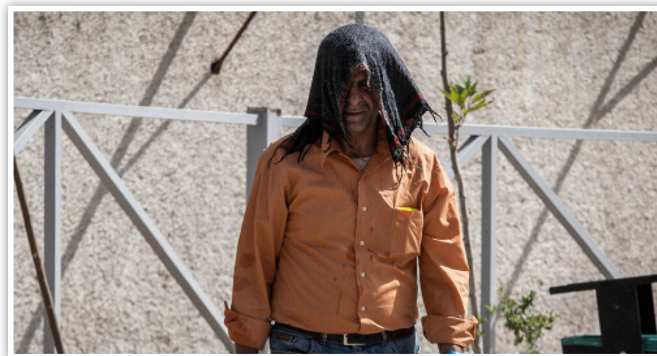
«رئیس گروه سلامت هوا و تغییر اقلیم وزارت بهداشت» پاسخ داد؛